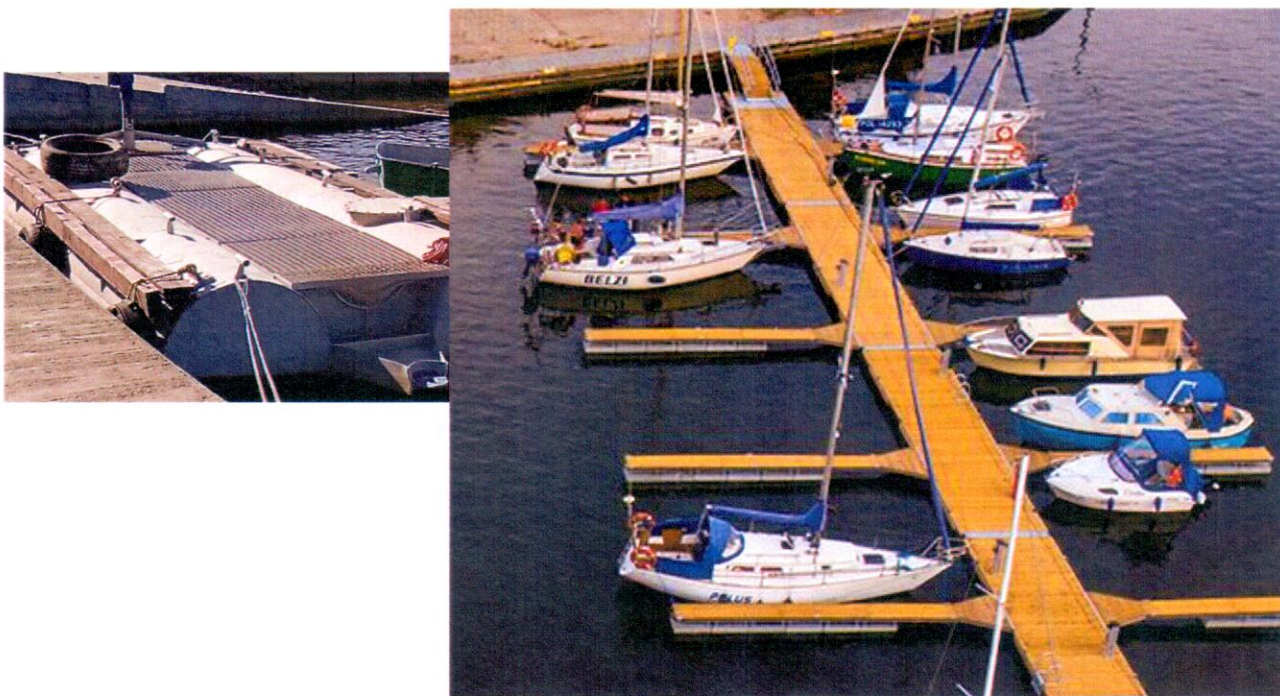
To zdjęcie na pewno nie jest z Płocka.

Miasto nie może być zakładnikiem grupy nawiedzonych czy też obrażonych osób. Za miasto odpowiedzialność przed Bogiem i Historio ponosi Prezydent Miasta i Rada Miasta. Naukowcy mówią, że przejawem głupoty jest powtarzanie tego samego eksperymentu z nadzieją, że uzyska się inny wynik. Biorąc pod uwagę tylko ostatnie 5 lat to nie należy się spodziewać niczego nowego.