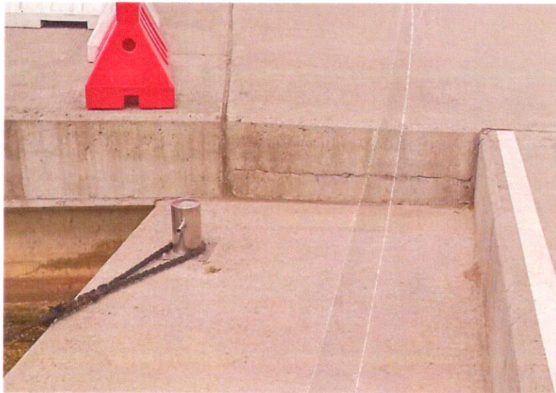
Rys.1 Istniejący stopień/uskok o wysokości 36

WOP-1, 20 P.A. Koparc 19.07.2024 [Signature]